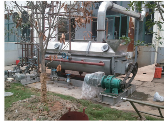
苏州美特尔干燥现场