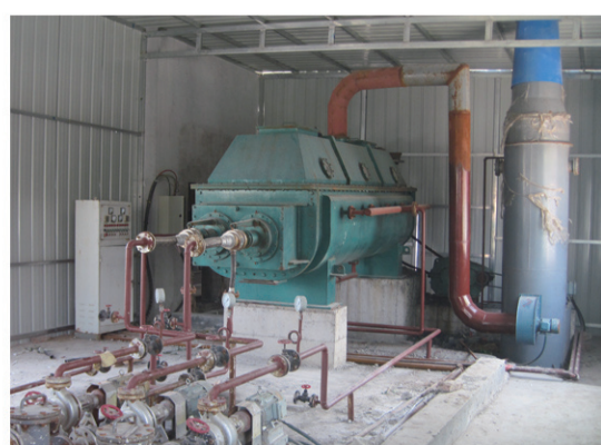
河北邯郸污水处理厂干燥现场