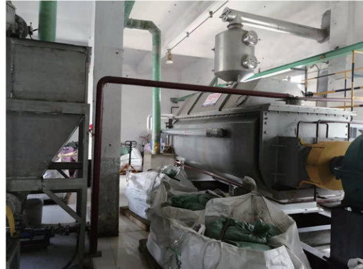
新华制药（寿光）干燥现场