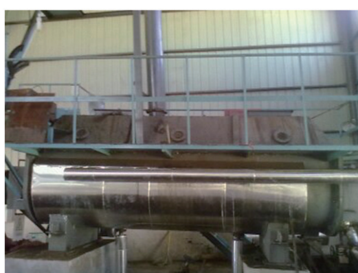
云南博浩菊花泥干燥现场