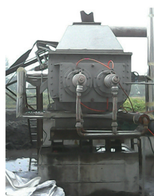
凯祥硅微粉干燥现场