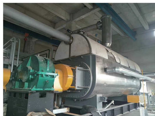
中石化沧州炼油厂干燥现场