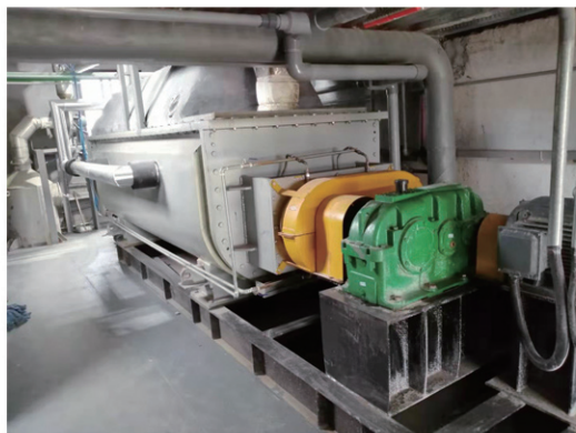
浙江昂利康制药股份干燥现场