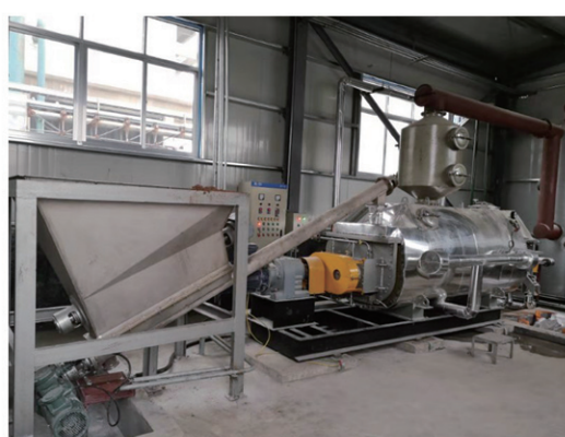
山东朗晖石油化学干燥现场