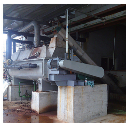
扬州锦农化工干燥现场