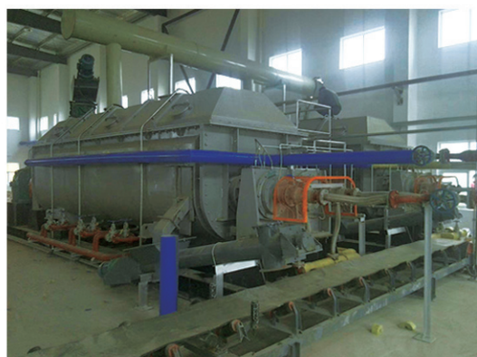
张家港合力能源干燥现场