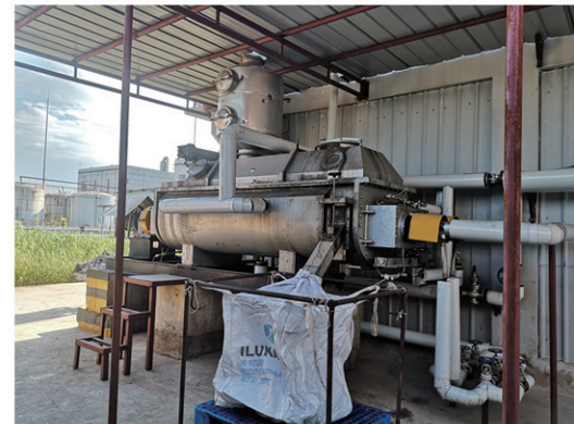
河北敬业医药干燥现场