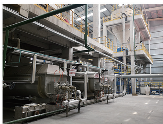
山东阿斯德科技干燥现场