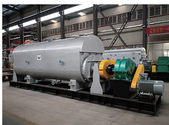
利尔化学 ( 广安 ) 有限公司