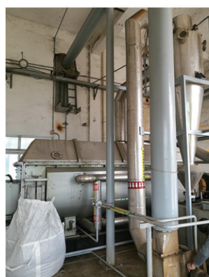
新浦化学 ( 泰兴 ) 干燥现场