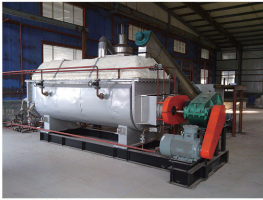
山东谦诚工贸干燥现场