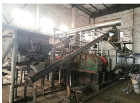
张家港合力能源干燥现场