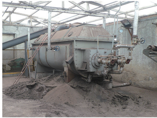
扬州创利皮革干燥现场