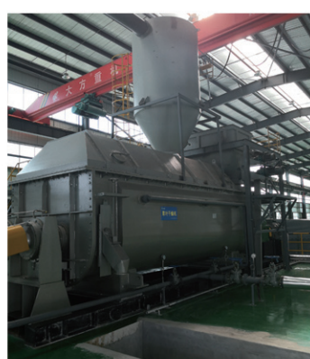
江苏永吉环保干燥现场