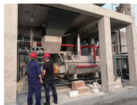
海门贝斯特精细化工干燥现场