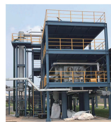
江苏新海石化空心桨叶干燥现场