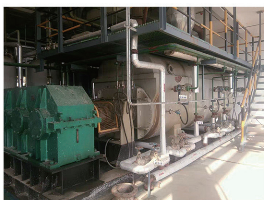
江苏优普生物化学干燥现场