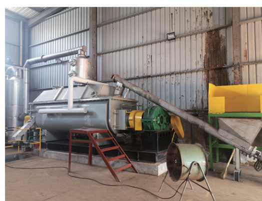
山东唐荣新型材料干燥现场