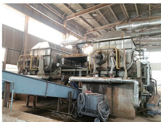
浦项 ( 张家港 ) 不锈钢干燥现场