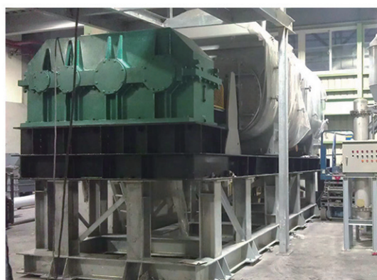
台湾大圆汽电干燥现场