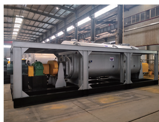
神华煤制油空心桨叶干燥机